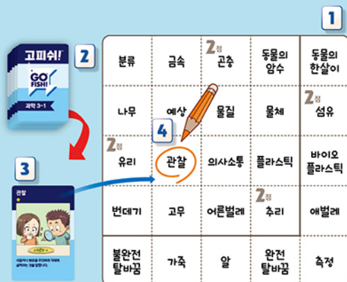
<게임 진행 예시>