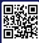
게임 설명 영상