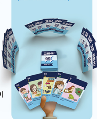
<4인 게임 준비 예시>

3 나눠주고 남은 카드는, 한 더미를 만들어 뒷면이 보이게 테이블 중앙에 놓습니다.