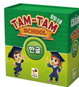
탐탐 스쿨 한글