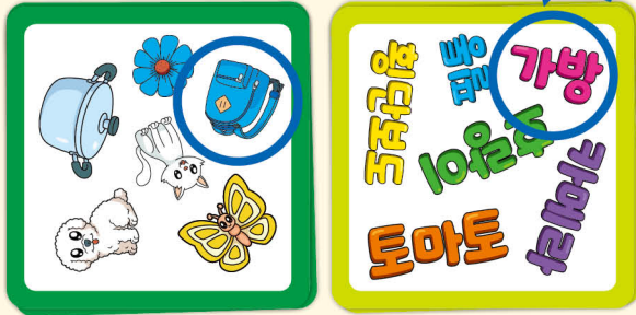
카드 가져오기 예시