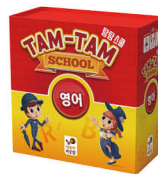
탐탐 스쿨 영어