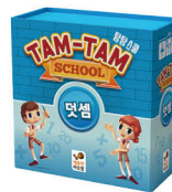
탐탐 스쿨 덧셈