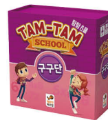
탐탐 스쿨 구구단