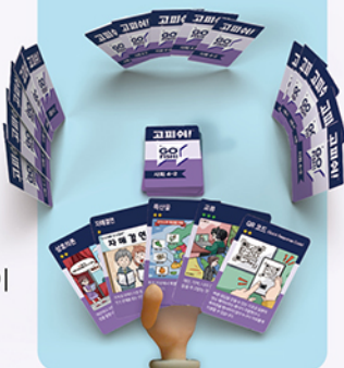
<4인 게임 준비 예시>

3 나눠주고 남은 카드는, 한 더미를 만들어 뒷면이 보이게 테이블 중앙에 놓습니다.