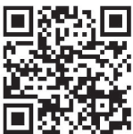
게임 설명 영상

PD의 숫자를 맞히지 못하더라도 토큰을 뚝 칸에 더 놓지는 않습니다. 그런 뒤 새 라운드를 시작합니다.