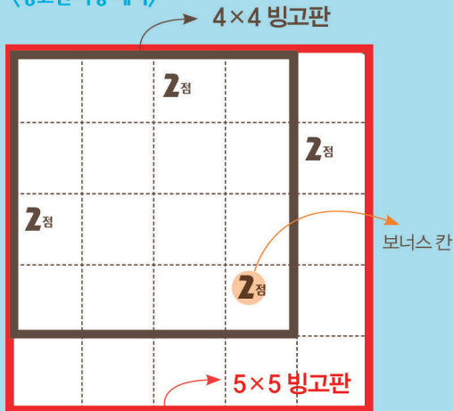
<빙고판 사용 예시>