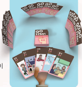
<4인 게임 준비 예시>

3 나눠주고 남은 카드는, 한 더미를 만들어 뒷면이 보이게 테이블 중앙에 놓습니다.