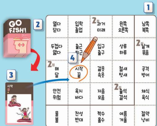
<게임 진행 예시>