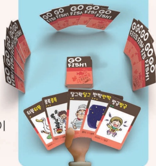
<4인 게임 준비 예시>

3 나눠주고 남은 카드는, 한 더미를 만들어 뒷면이 보이게 테이블 중앙에 놓습니다.